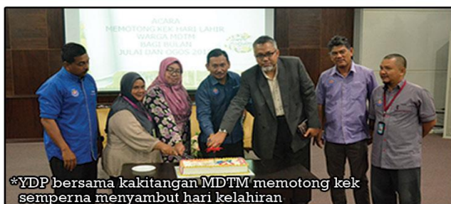
*YDP bersama kakitangan MDTM memotong kek semperna menyambut hari kelahiran