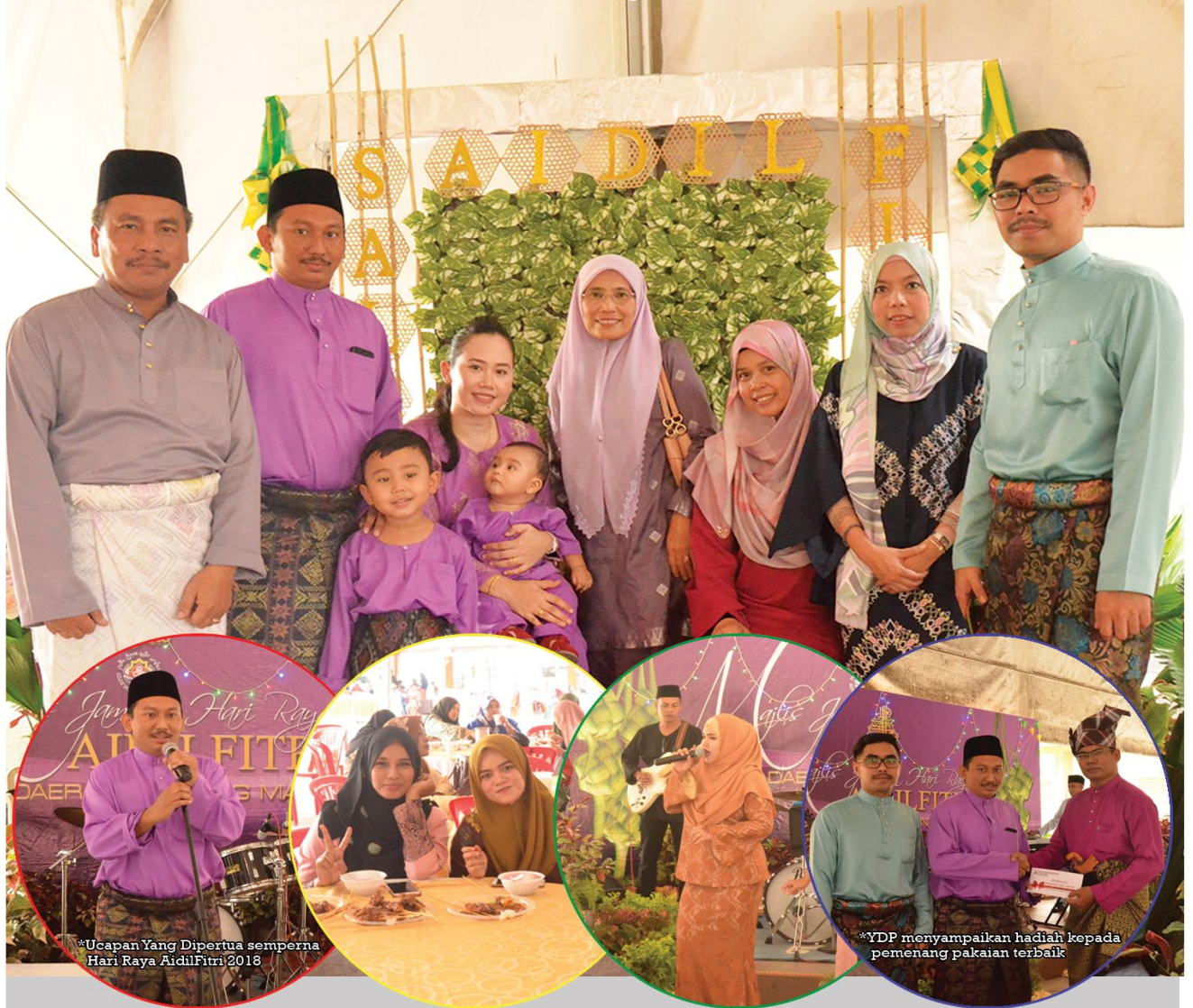
*Ucapan Yang Dipertua semperna Hari Raya Aidilfitri 2018