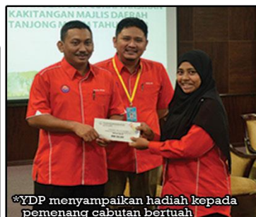
*YDP menyampaikan hadiah kepada pemenang cabutan bertuah