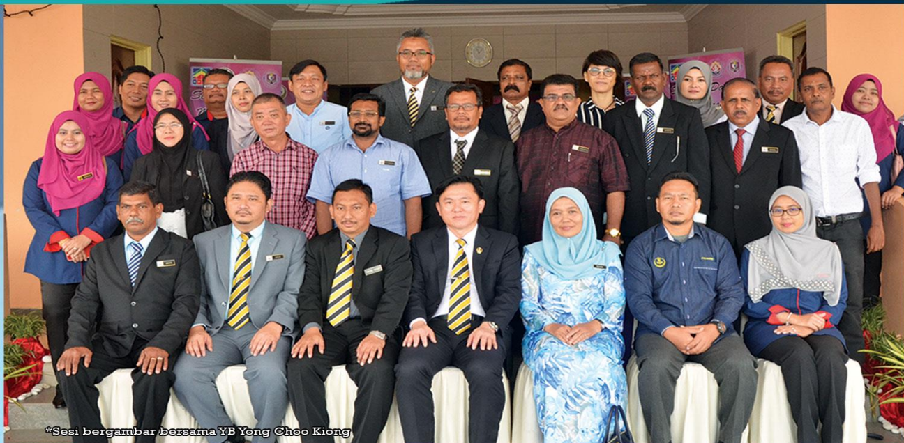
*Sesi bergambar bersama YB Yong Choo Kiong