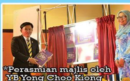
*Perasmian majlis oleh YB Yong Choo Kiong