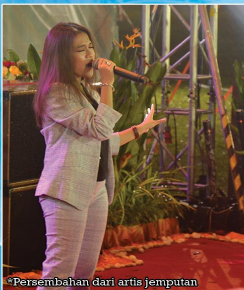
*Persembahan dari artis jemputan