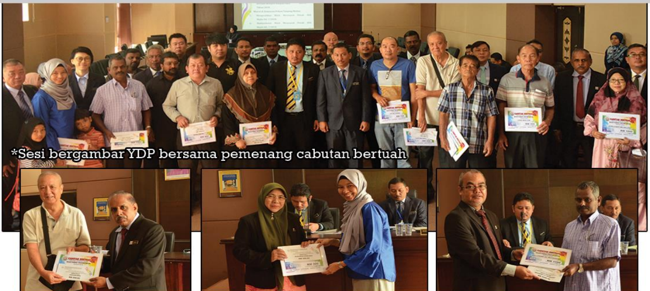
*Sesi bergambar YDP bersama pemenang cabutan bertuah

30 November 2018 | Auditorium Seri Tanjung, MDTM