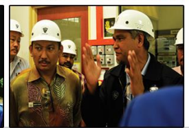
*YDP menyampaikan cenderahati kepada wakil Proton City